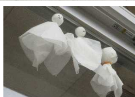
心配だった雨は降りませんでした!

授業参観では、一人一人の体験発表をお聞きくださりありがとうございました。今後の深耕タイムで、改めてレポートにまとめる予定です。遠足実施への御理解と御協力もありがとうございました。